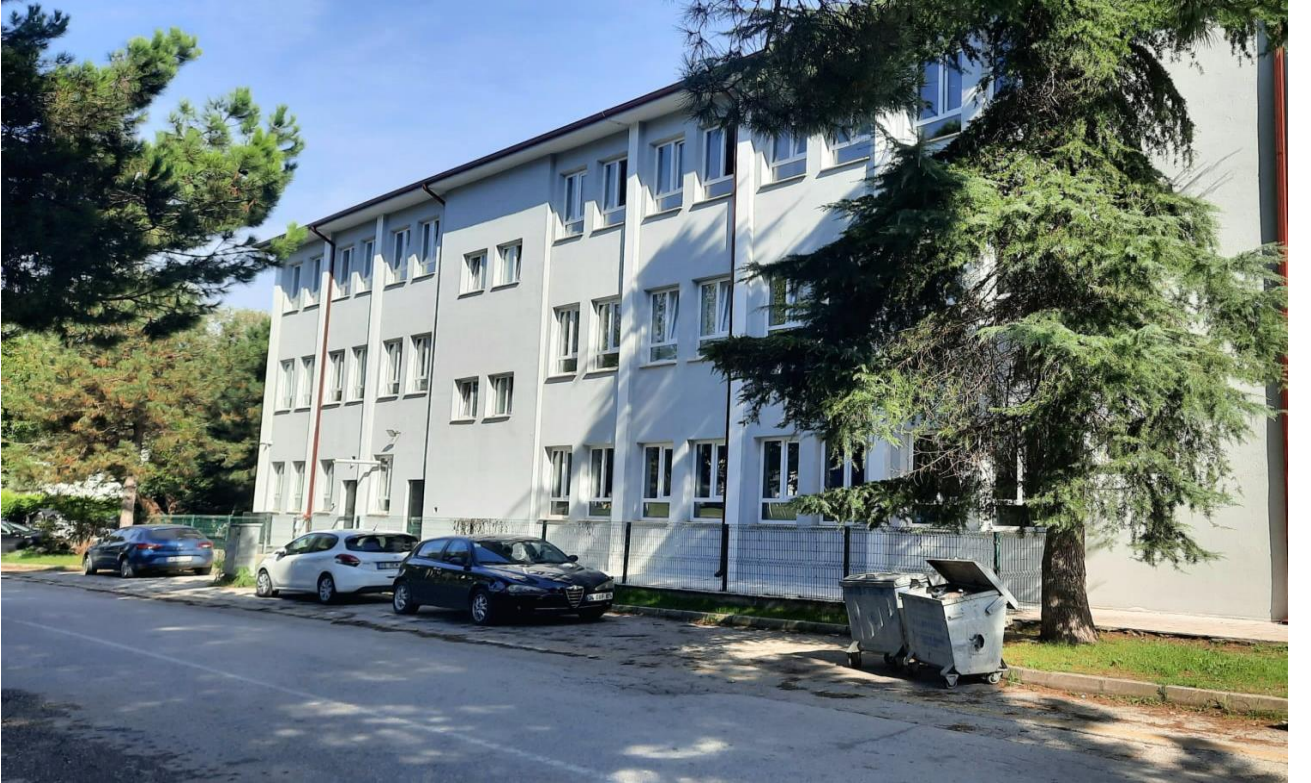
OKULUMUZUN DIŐ GÖRÜNÜMÜ