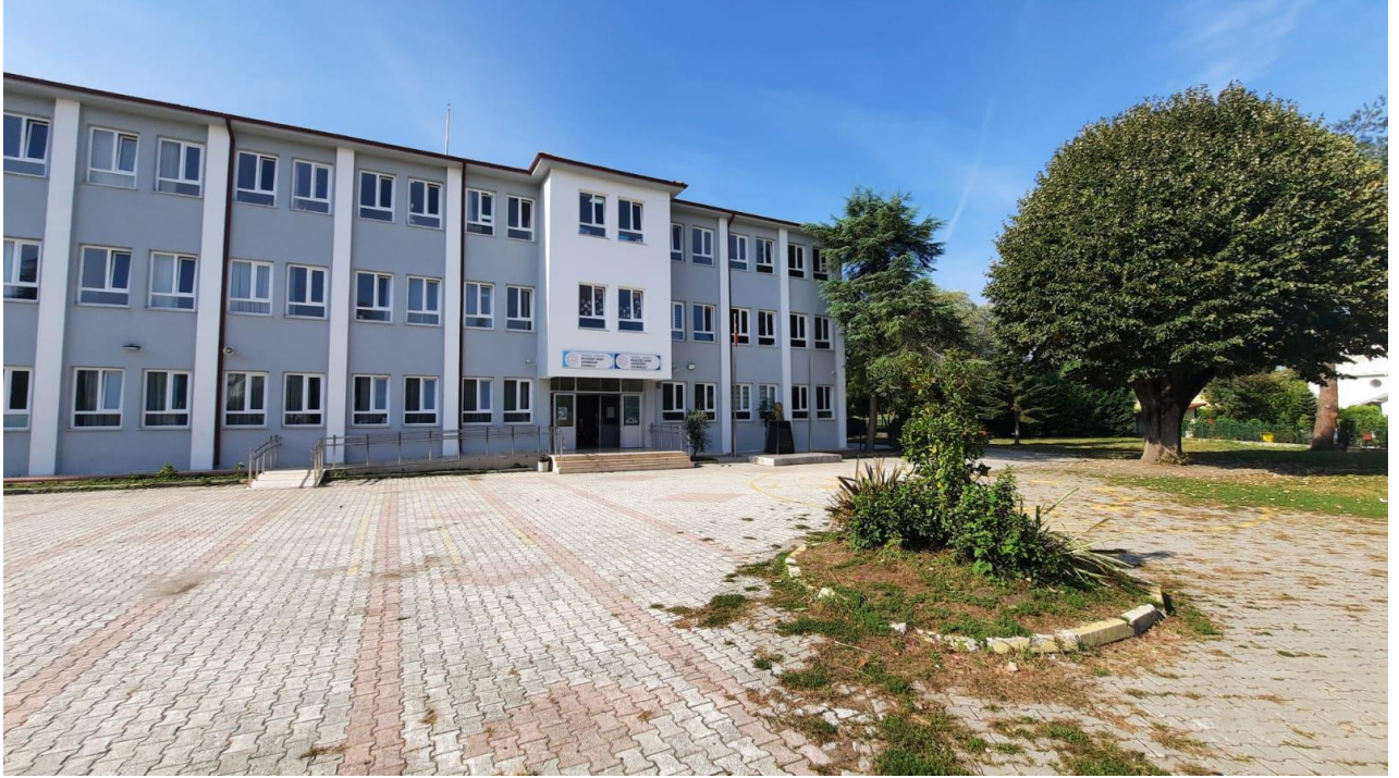
OKULUMUZUN DIŐTAN GÖRÜNÜMÜ