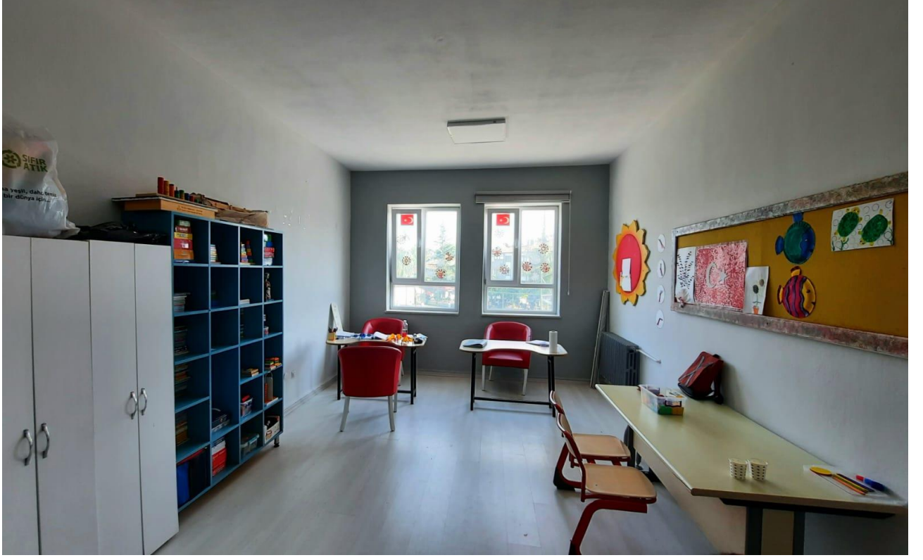
ÖZEL EĞİTİM SINIFIMIZ