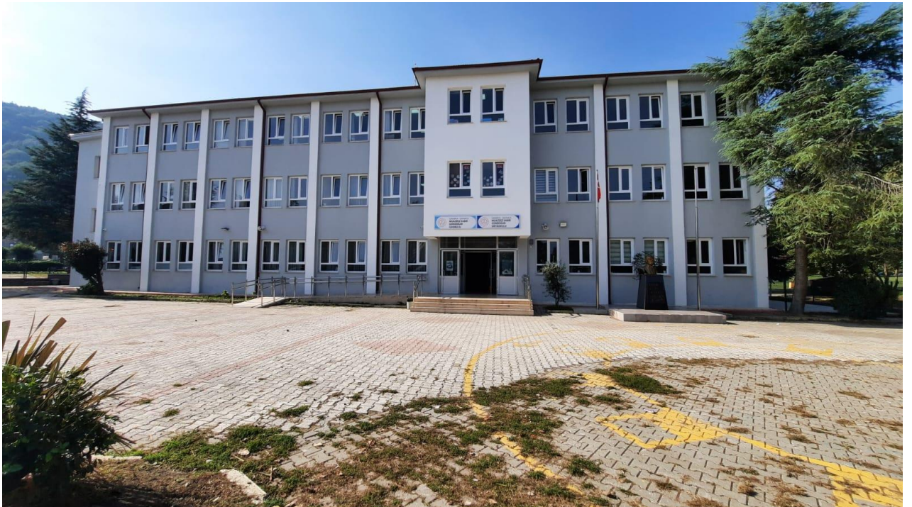
OKULUMUZUN DIŐTAN GÖRÜNÜMÜ