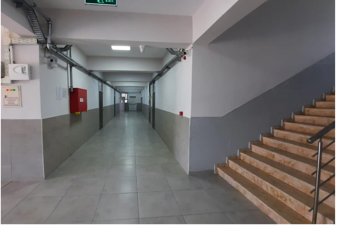
OKULUMUZUN İÇTEN GÖRÜNÜMÜ